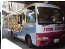
移動図書館(月1回) 高知市民図書館 たんぼぼ号