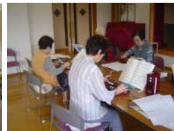
サークル活動 唄・パークゴルフ 詩吟・手芸・踊り