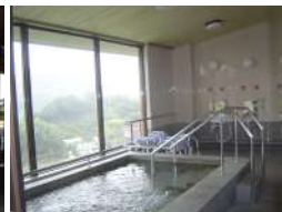
最上階の展望浴室 トロン温泉