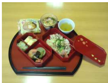
誕生日会のお食事