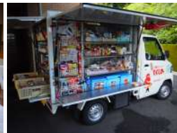
移動スーパー 「とくし丸」 毎週 月・木曜日