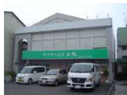
デイサービス土佐 ご利用者の一人ひとりのペースに合わせたサービスを提供