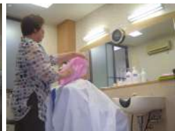
理容(月2回) 美容(週1回)